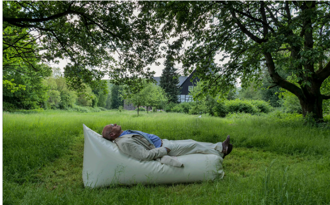
Interaktive Klanginstallation, Komposition aus Körperschall- und Ultraschallklängen, Audio-Kissen.

Die Ausstellung „sonic bonds“ greift die Geschichte der ehemaligen Schlosserei auf und entwickelt eine immersive Klanginstallation u. a. mit den Ruflauten der Werkstatt, dem „Anklingeln“ am Amboss. Der Ort, der früher durch Arbeit und Rhythmus geprägt war, wird zum Resonanzraum für Kommunikation und Empathie. Über Körperschallrezeptoren wird der ausgegebene Klang als körpernahe Wahrnehmung spürbar und zum akustischen Pendel zwischen Raum und Körper, Nähe und Distanz.