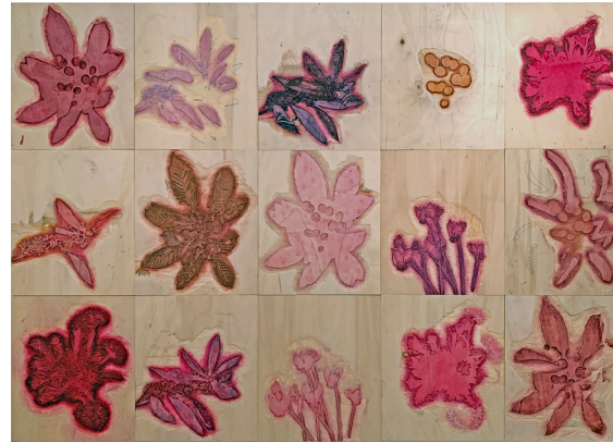
o.T., Wandinstallation Holzdruckplatten, 180 x 250 cm, 2025, Foto: N. Wehler

Die drei Inseln Iwaishima, Paxos und Island durchlebten einen Wandel, bei dem sich ihre Bewohner entzweiten: über den Bau eines Atomkraftwerkes, über den Einsatz von tödlichen Giften in der Landwirtschaft und über die Zerstörung natürlichen Lebensraums durch Industrie.