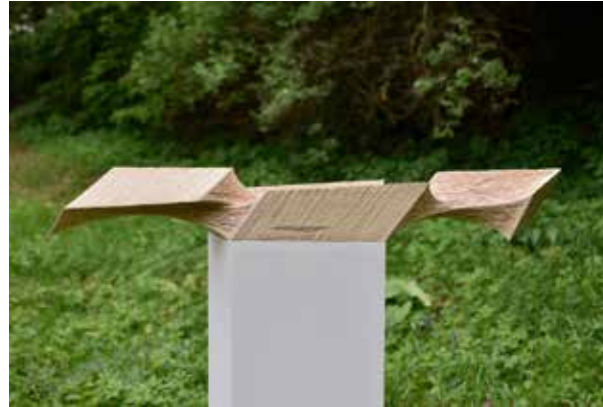
Linde 20/03, 16 x 116 x 16 cm, 2020

Bewegungen machen Raum und Zeit erfahrbar, ja formen sie aus und lassen sie anschaulich werden. Sie sind Heiko Börners ureigenes Thema, wozu er sich primär das Holz als Material gewählt hat. Seine Arbeiten verblüffen jeden Betrachter, scheint doch unter seiner Bearbeitung das Material akrobatische Kunststücke zu vollführen: sich zu dehnen, umzuwenden, zu drehen, emporzuspringen, sich pilzartig aufzustülpen und vieles mehr. Ausgangspunkt sind zumeist stereometrische Körper, vor allem Kuben mit ungleichseitigen Vierecken sowie Kugeln, deren Oberfläche geglättet oder schariert sind. Dazwischen aber fasert der Bildhauer das Holz mit vielen kleinen Beilieben auf und gibt ihm den Anschein eines elastischen, streck-, dreh- und verformbaren Materials, dessen Windungen und Spannungen die interessanten, räumlichen Beziehungen der Kuben und Kugeln untereinander definieren und das vergangene, gegenwärtige und noch zu erwartende Geschehen zwischen den Körpern aufzeigen. Heiko Börner erweckt den Eindruck, dass die Körper sich durchdringen, umeinander drehen, miteinander verschmelzen oder sich wieder voneinander lösen. Der Betrachter erlebt diese Bewegungen als Raum schaffend und bleibt dabei selbst in der spannungsvollen, faszinierenden Ungewissheit, inwieweit die Bewegung noch in gleicher Richtung weiterführen wird oder ob bereits ein Umkehrpunkt wie im Jojo-Spiel erreicht ist.